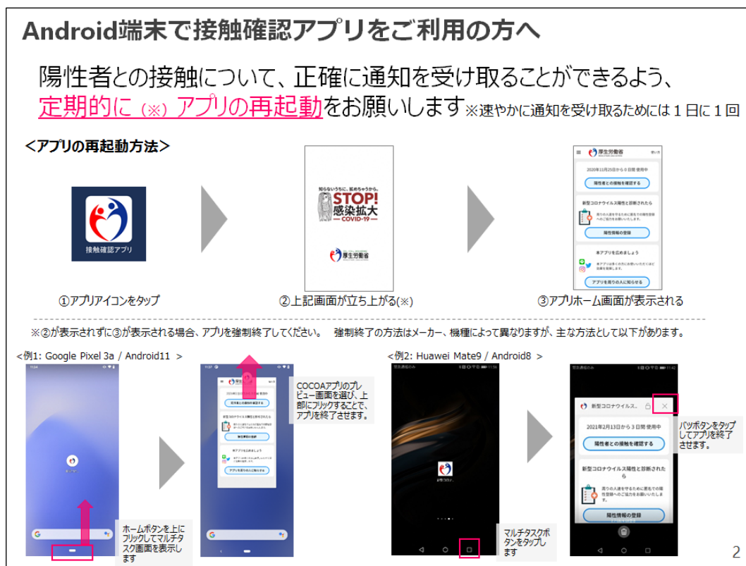
図 2 Android 版の再起動方法（関連情報 3）から引用）

今回明らかになった接触通知機能に関する不具合は、2020 年 9 月 28 日の更新（バージョン 1.1.4）で新たに生じました。2021 年 2 月 18 日の更新（バージョン 1.2.2）で修正が図られたものの、正確な通知を受け取るためには 1 日に 1 回程度 COCOA を再起動する必要があると案内されています。ただし、次回以降の更新で再起動が不要になる可能性もあり、利用しやすくなることが期待されます。